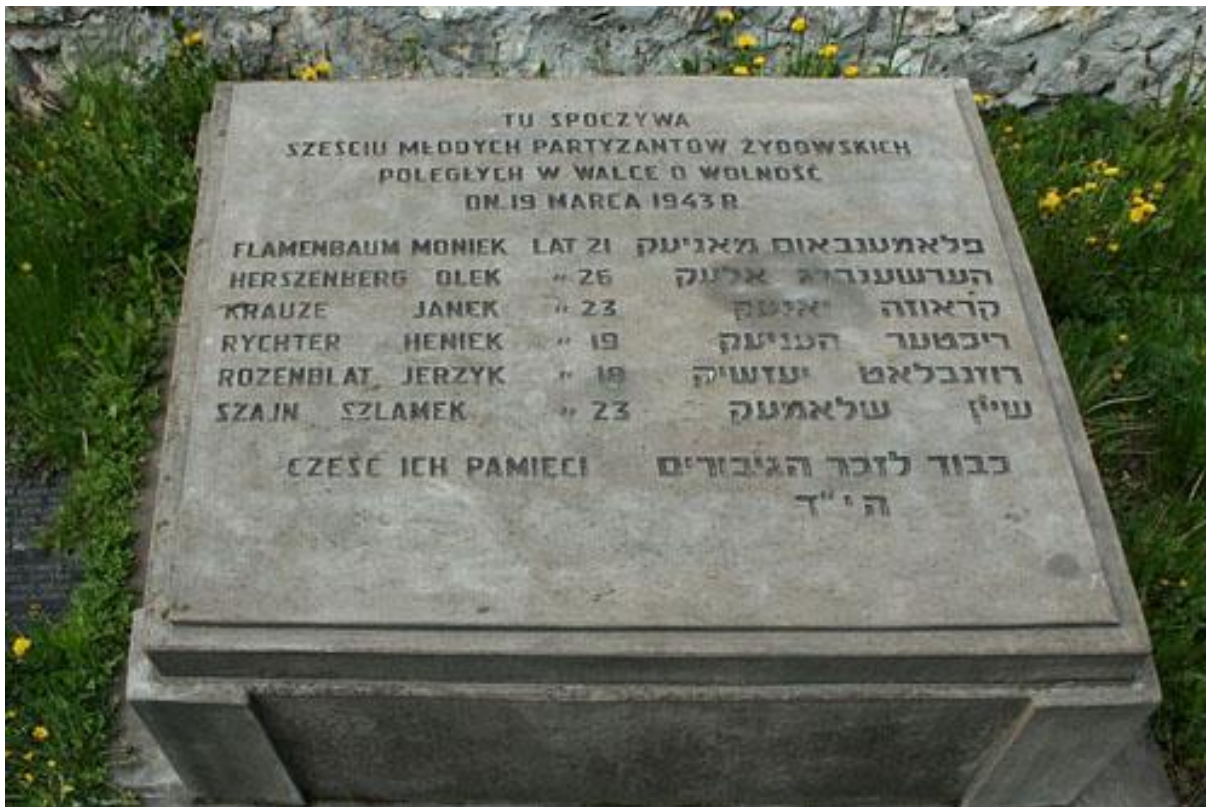
Obraz grobu sprzed wielu lat, dziś częściowo jest trudny do odczytania

Wiesław Paszkowski, Muzeum Częstochowskie, Ośrodek Dokumentacji Dzieńw Częstochowy Edycja: Alon Goldman, Prezydent - Stowarzyszenie Częstochowa Żydów w Izraelu