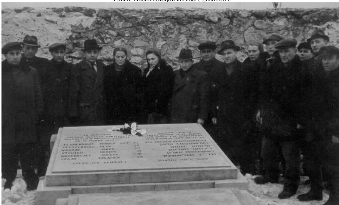
Częstochowa 1946 - Uroczystość upamiętniająca sześciu partyzantów

התאחדות יוצאי מחוז צ'נסטוחוב (דור ההמשך ער) בישראל Association of Częstochowa District Jews in Israel ת.ד 65050 תל אביב 61650 – טל: 03-6749322 – P.O.B 65050 Tel Aviv 61650 E mail: czestochowajewsinsrael@gmail.com