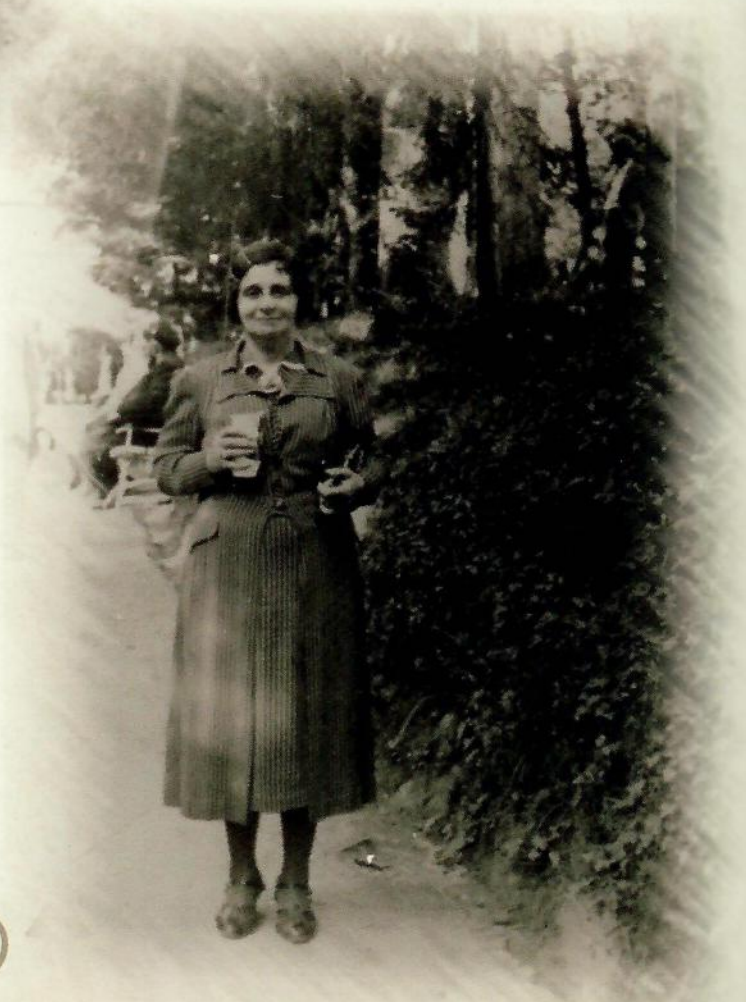
אמא בבית הבראה